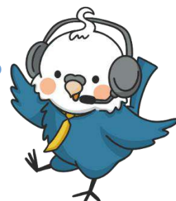
ロウムノコトリさん